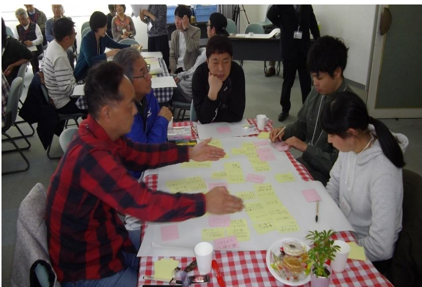
グループ内での意見の共有、つけ足し