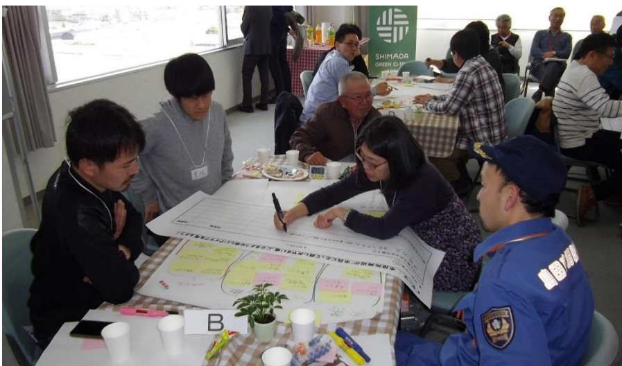
発表に向けて準備