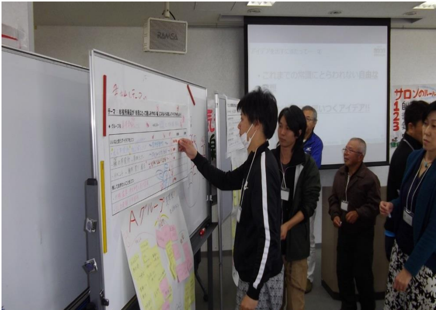
いいなと思うアイデアに投票