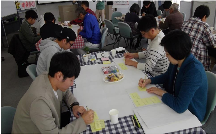
テーマに対する書き出し