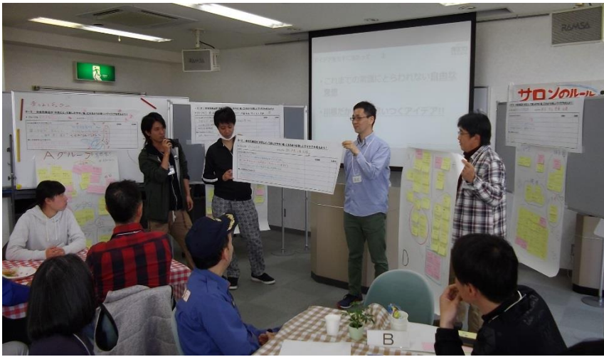
グループの皆で発表！