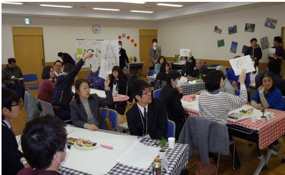
最初に“自称”平昌オリンピック研究所所長による五輪マーククイズでアイスブレイク