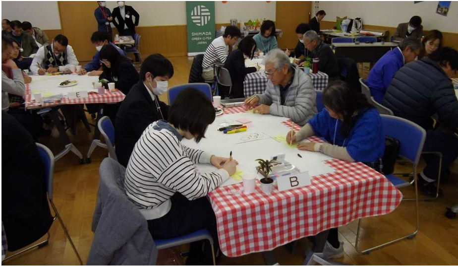
「テーマ」に対する個々のアイデアを書き出します