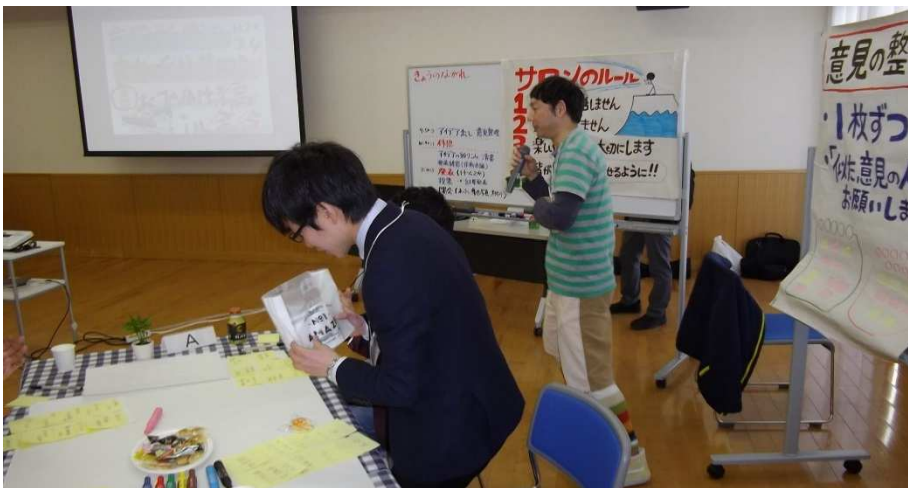
一番多くアイデアを書き出した方には景品がプレゼントされました