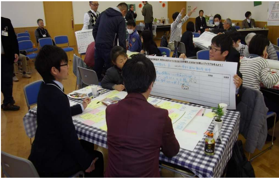
発表において準備します