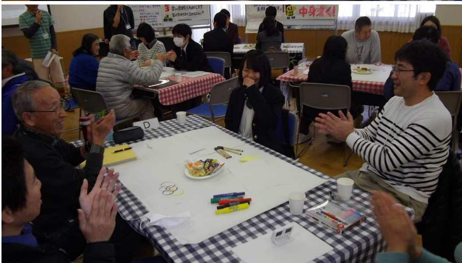
まず、グループ内で自己紹介