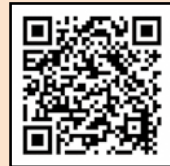
▲おいしくヘルシー 応援店

市内には、市民の健幸を応援する「おいしくヘルシー応援店」があります。おいしくヘルシー応援店を利用して、健幸になりましょう！