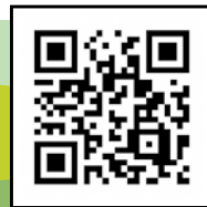
▲適塩動画は こちらから