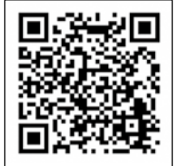
島田市ホームページ （がん検診）

あなたの健康とご家族の生活を、がんや生活習慣病から守るために、ぜひお受けください。