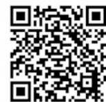
▲ホームページは こちらから

【島田市コミュニティバス】 ●相賀線(はなみずき入口下車) ●島田駅東線(保健福祉センター入口下車) 【しずてつジャストライン】 ●島田静波線(保健福祉センター下車)※平日のみ ●金谷島田病院線(保健福祉センター入口下車)※平日のみ ※駐車場はセンターの南北にあります。台数が少ないため、乗り合わせや公共の交通機関をご利用ください。