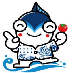
焼津市 「やいちゃん」