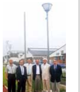
島田ロータリークラブのメンバーと街路灯

島田ロータリークラブの皆さんが、南相馬市鹿島区の金谷前公園にLEDタイプの防犯灯1基(50万円相当)を寄贈してくれ、桜井勝延南相馬市長から、感謝状が渡されました。公園は保育所の裏にあり、仮設住宅の避難者の散歩道になっていますが、付近には街路灯がなく、不安な日々を送っていました。また、島田市の皆様には、市職員3人を1年間派遣してくださっており、感謝しております。(南相馬ロータリークラブ会長)