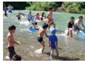
伊久美川での水遊び

東日本大震災で、福島 ほそやりのうた の美しい自然に暗い影が落ち、食物に不安がつきまとい困窮している時、東町のLWF教会からトラックで、各種支援物資が何回も届きました。嬉しさで胸一杯になりました。教会をはじめ、島田市の皆様の温かいお心遣いを心深く刻み込んでおくために、今回サンキューツアーが実現しました。8月17日から20日までの期間でしたが、小学生ら総勢34名は、各方面からのご配慮により、キャンプ場に泊まったり、ミニSL列車に乗ったりと、忘れられない感謝の旅となりました。ありがとうございました。(福島こひつじ幼稚園 園長) ※