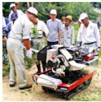
竹破砕機を使う様子