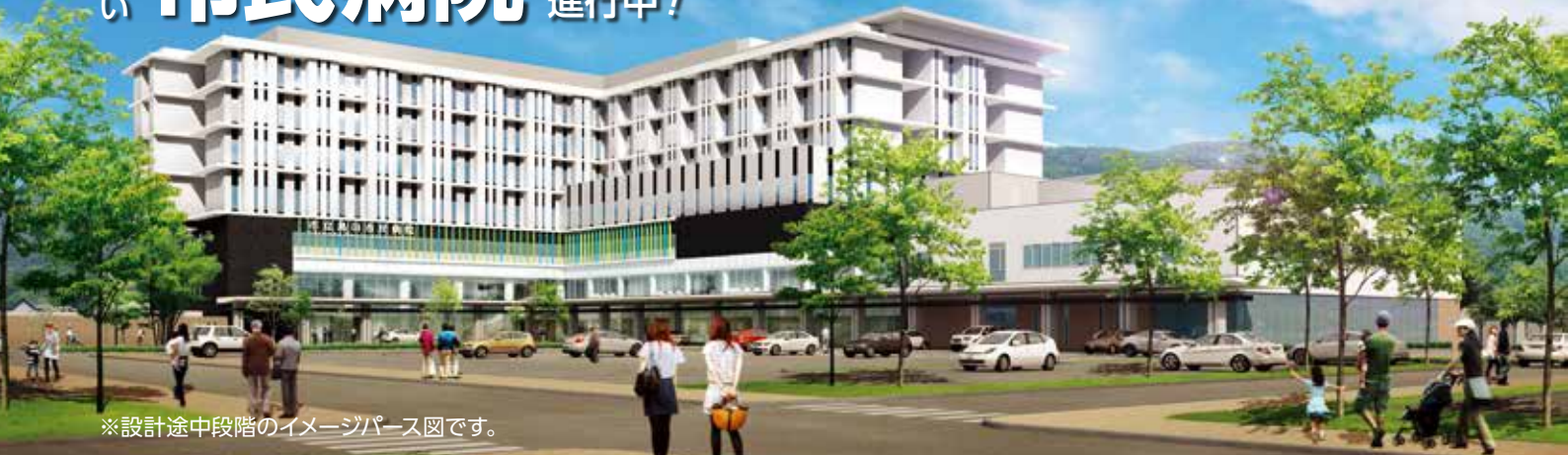
※設計途中段階のイメージパース図です。