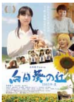
「向日葵の丘」ポスター

※プラザおおるり、夢づくり会館、川根文化センター、池田時計店、大鉄観光サービスで販売中。