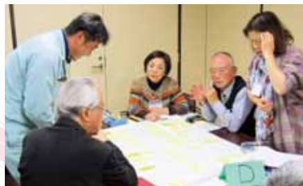
分科会で話し合う委員(第1期)

市では、委員の活動を公表し、新たな市民活動につながるようにサポートしていきます。また、百人会議とともに、活気あるまちづくりの推進を目指していきます。