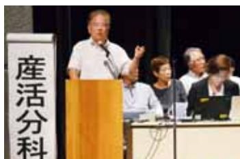
提案を発表をする委員

10月18日には全体会が開かれ、約60の提案に対して、市からの回答が行われました。市では、