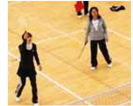
ファミリーバドミントン