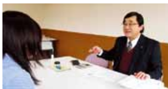
親身に相談に乗ります