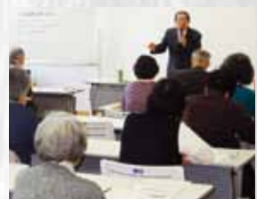
熱心に学ぶ受講生