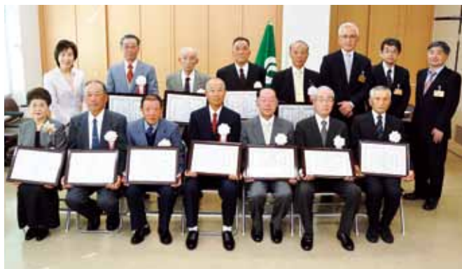
交通安全表彰を受章した皆さん