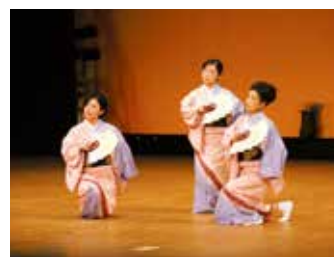
さまざまな文化芸能を発表する