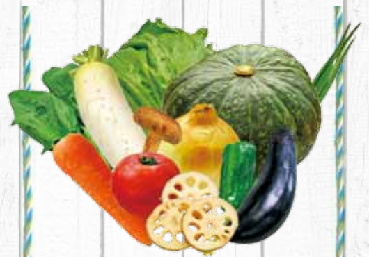
旬の野菜詰め合わせ