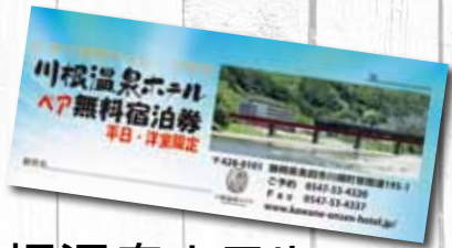
川根温泉ホテル ペア無料宿泊券