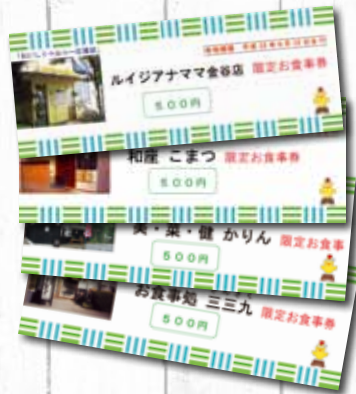
市内飲食店 食事券