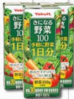
ヤクルト商品 1ケース