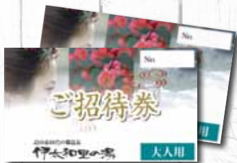
伊太和里の湯 入浴券

前期・後期には「みかん詰め合わせ」「コミバス回数券」「やまゆり特産品詰め合わせ」などもご用意!