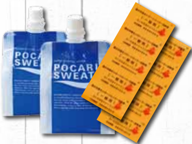
ポカリスエット ゼリー ローズアリーナ利用券