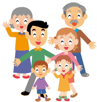
▽後期高齢者医療保険料率の改正表