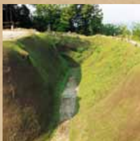
堀整備工場の現場

天気の良い日には、富士山や島田市街を一望することもできますので、整備が進む諏訪原城跡を訪れてみてください。