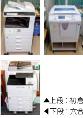
▲上段：初倉 ▲下段：六合