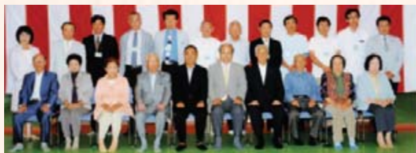
受賞者記念撮影 6月3日歯の市民フェスティバル

8020コンクールは、80歳を過ぎても自分の歯が20本以上ある健康な人を認定します。今年は31人が認定され、うち8人が表彰されました。