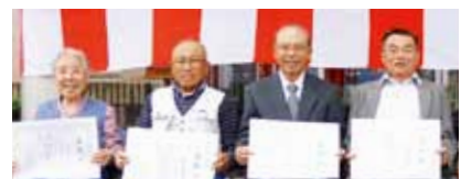
8020コンクール上位8人