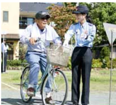
自転車交通安全教室

7月11日から20日(土)まで「夏の交通安全県民運動」が実施されます。今年に入り、市内で発生した交通事故死は8件(6月20日現在)と、昨年の年間件数7件をすでに上回っています。市では、夏の運動をとおり、交通事故発生を抑止を市民の皆さんに呼び掛けていきます。