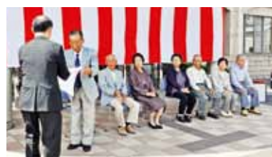
上位の皆さんの授賞式

では、80歳を過ぎても自分の歯が20本以上ある健康な人を認定しています。今年32人を