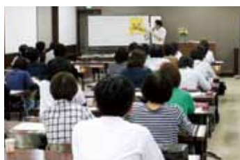
スキルアップを目指して

▶平成19年に、市内の子育て支援に関わる団体が、子育て支援の輪を広げていくことを目的に結成したのが「島田市子育て支援ネットワーク」です。このネットワークでは、それぞれが持つ情報を共有し合い、連携して大きなネットワークをつくり、子育てに関する支援をしています。