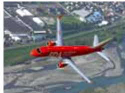
島田市上空の航空機

航空機は空気の濃度と抵抗のバランスを取るため、上空約1万mを飛行。気温は、地上から100m上昇するにつれて約0.6℃下がることから、上空1万mでは、地上より60℃ほど低くなります。そのため、機内で快適に過ごすには、気温の調整が必要です。実は、その方法は、燃料などで暖めているのではなく、圧縮させると熱をもち、膨張させると冷たくなる空気の性質を利用した機体の設備で行っているのです。とってもエコな空調設備なんですね。