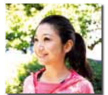
いちはし あり 市橋 有里さん

1999年世界選手権セビア大会で銀メダルを獲得。世界大会のマラソン種目で、史上最年少のメダリスト。2000年シドニーオリンピックにも出場しました。