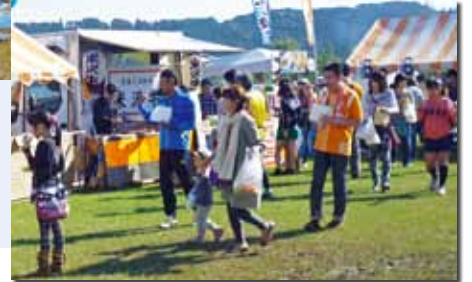
昨年のふれあい交流イベント