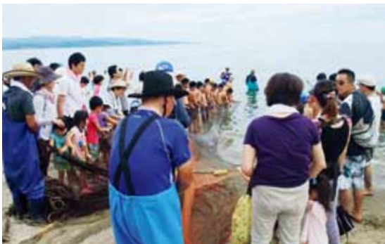
力を合わせて挑戦した地引き網漁

異なる地域の仲間と3日間行動を共にしたことで、子ども同士の交流が育まれて多くの友達ができ、団員たちにとっては夏休みの良い思い出になりました。