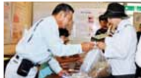
啓発用品の無料配布

参加団体/ 静岡県浄化槽協会 志太榛原支部、下水道課、環境課、田代環境プラザ、給食残さず食べさせ隊、生活クラブ生協静岡志太支部