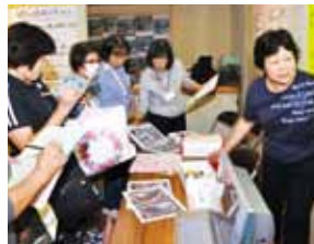
生ごみ処理機の説明

参加団体/ 島田市消費者グループ、川根消費生活桜美会、金谷ライフクリエイターサークル、NPO 法人しまだ環境ひろば、ガールスカウト静岡県第17団、静岡県地球温暖化防止活動推進センター