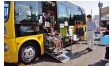
車いすによる昇降を体験

昨年に続き「くらし・消費・環境展2015」でコミバス車両の展示・車いすでの乗車体験・記念撮影・ペーパークラフトの配布を予定しています。ぜひ、お越しください。