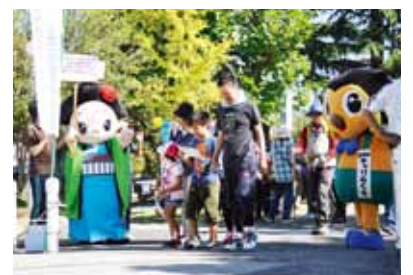
昨年のオープニングイベント