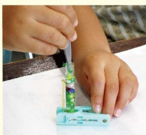
ビーズをつめる様子