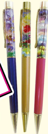
過去の参加者作品