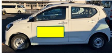
▼広告掲載イメージ 1