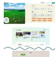
市公式 WEB サイト