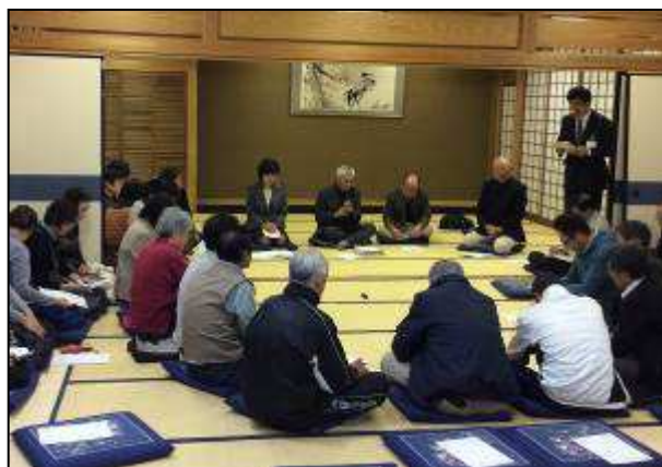
車座トークの様子（H27.12.14 大津自治会）

具体的には、「市民ワークショップ」や「タウンミーティング」、「市民意識調査」など相対型的手法を用いて幅広い年代から意見を収集するほか、平成27年12月からはじまった「車座トーク」の意見も参考にして計画に反映していきます。