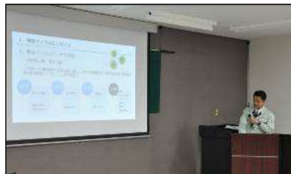
防災マイスター育成講座閉講式（H27年度）

南海トラフ地震の想定震源域にある当市は、浜岡原子力発電所との距離が近いことや広大な山間地を持つという地域特性があります。このため、歴史的な大激変に遭遇する可能性を視野に入れ、あらゆる事態に対応できる職員の育成と組織の柔軟性、さらに、地域で核となる人物を地域で育て、地域の総合力・対応力を上げていく必要があります。